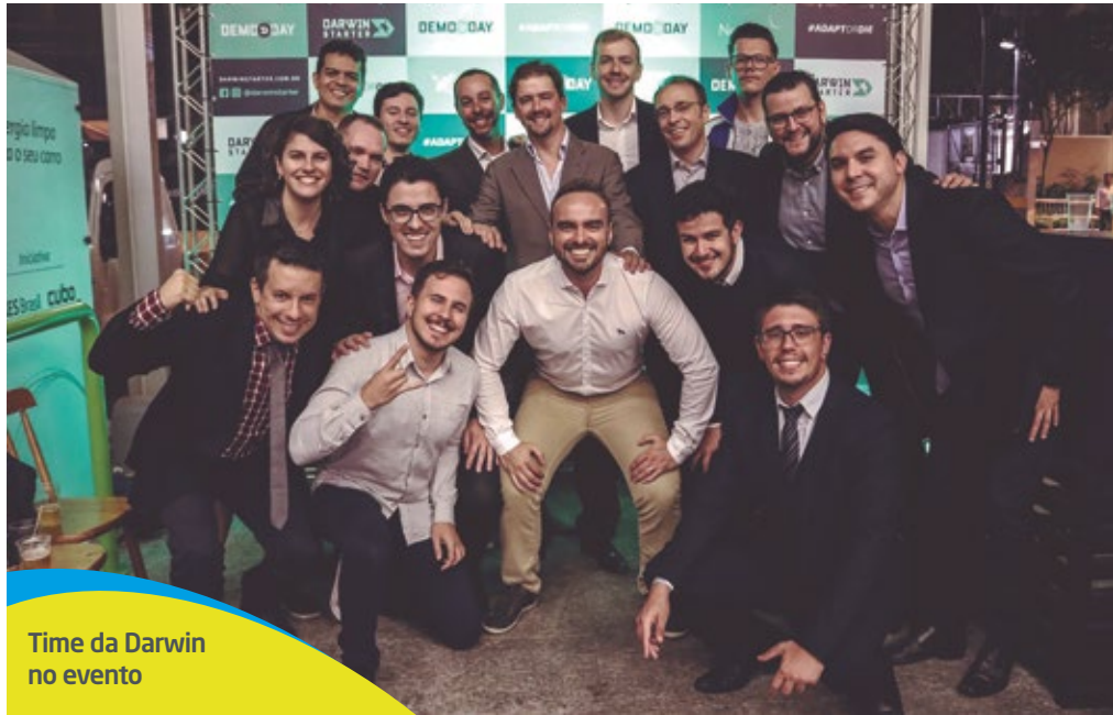
Time da Darwin no evento

O programa de aceleração da Darwin Starter conta com parceria da RTM, B3, Neoway e CNseg. Mais informações podem ser obtidas no endereço: http://darwinstarter.com.br/