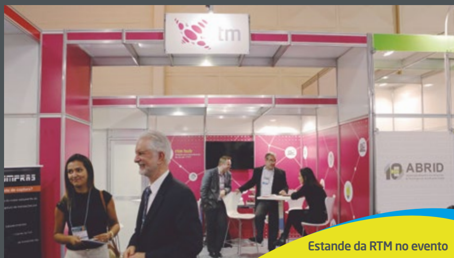
Estande da RTM no evento

A programação da Cards Payment & Identification é composta por uma série de eventos simultâneos, como palestras, debates, e reúne os principais especialistas do setor para abordar as novidades em meios de pagamentos, mercados de cartões, estratégias para o e-commerce, inovações para o varejo, fintechs e certificação digital.