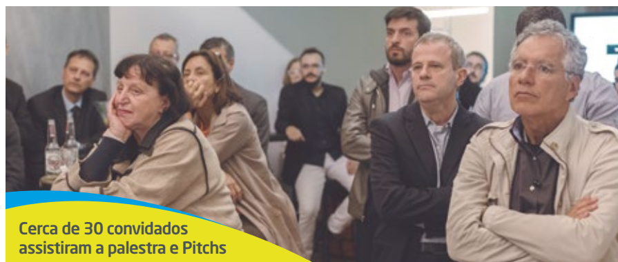
Cerca de 30 convidados assistiram a palestra e Pitches

A cobertura completa do evento está no YouTube no endereço: https://www.youtube.com/c/rmttelecom